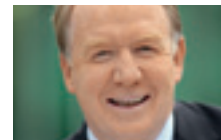
Dr. hc. Hans Michelbach, MdB Landesvorsitzender der MU